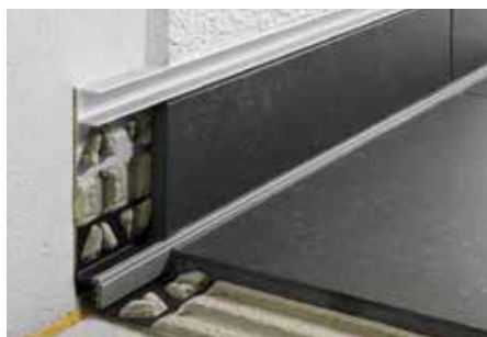
Osazení v oblasti soklu