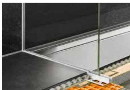
Osazení s prosklenou stěnou v oblasti sprchy