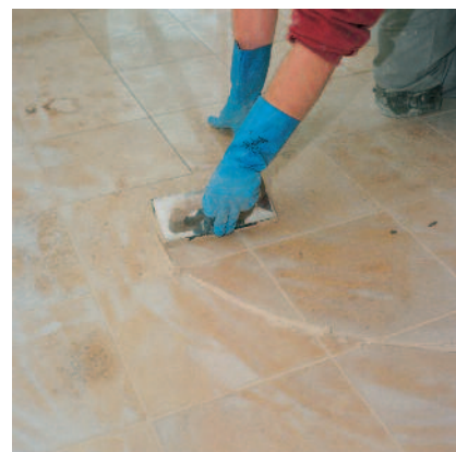
Spárování mramoru a desek z přírodního kamene spárovací hmotou PCI Carrafug®.